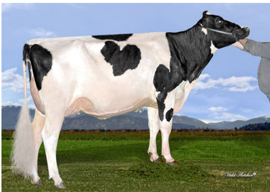
WESTCOAST POPSTR SIL6827 8977 DAUGHTER